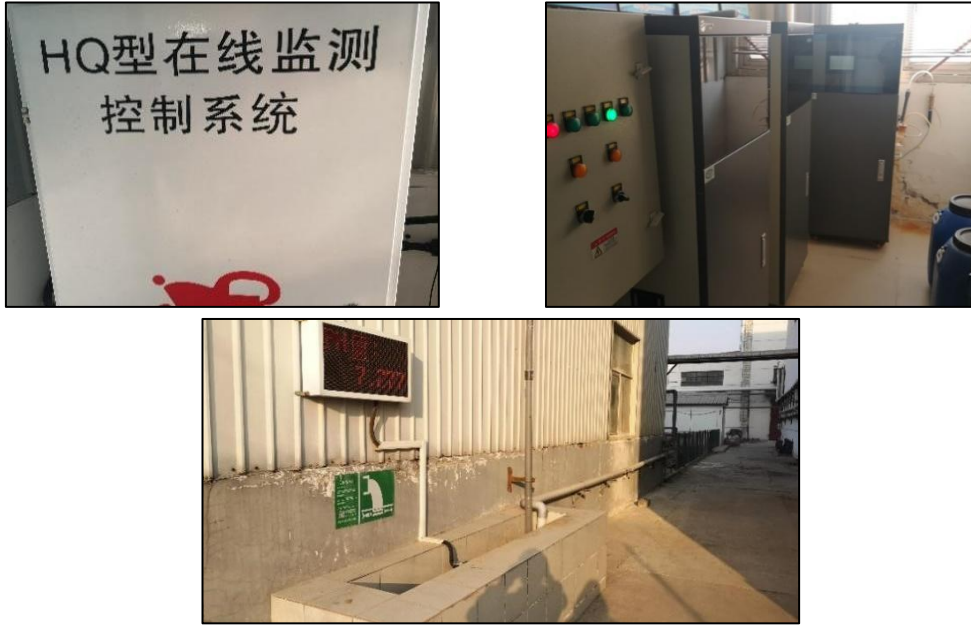
图 2.3-3 污水总排口规范化

现有污水处理站出水口处已安装流量计测量流量，并安装有 pH、COD、氨氮、总磷的水质自动在线监测系统，同时在污水处理站及排污口附近醒目处设置了环境保护图形标志牌。现有污水总排口规范化建设情况见下图。