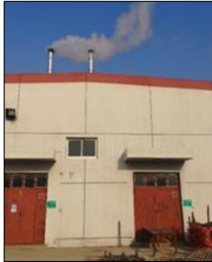
排气筒 P23 (左)、P24 (右)