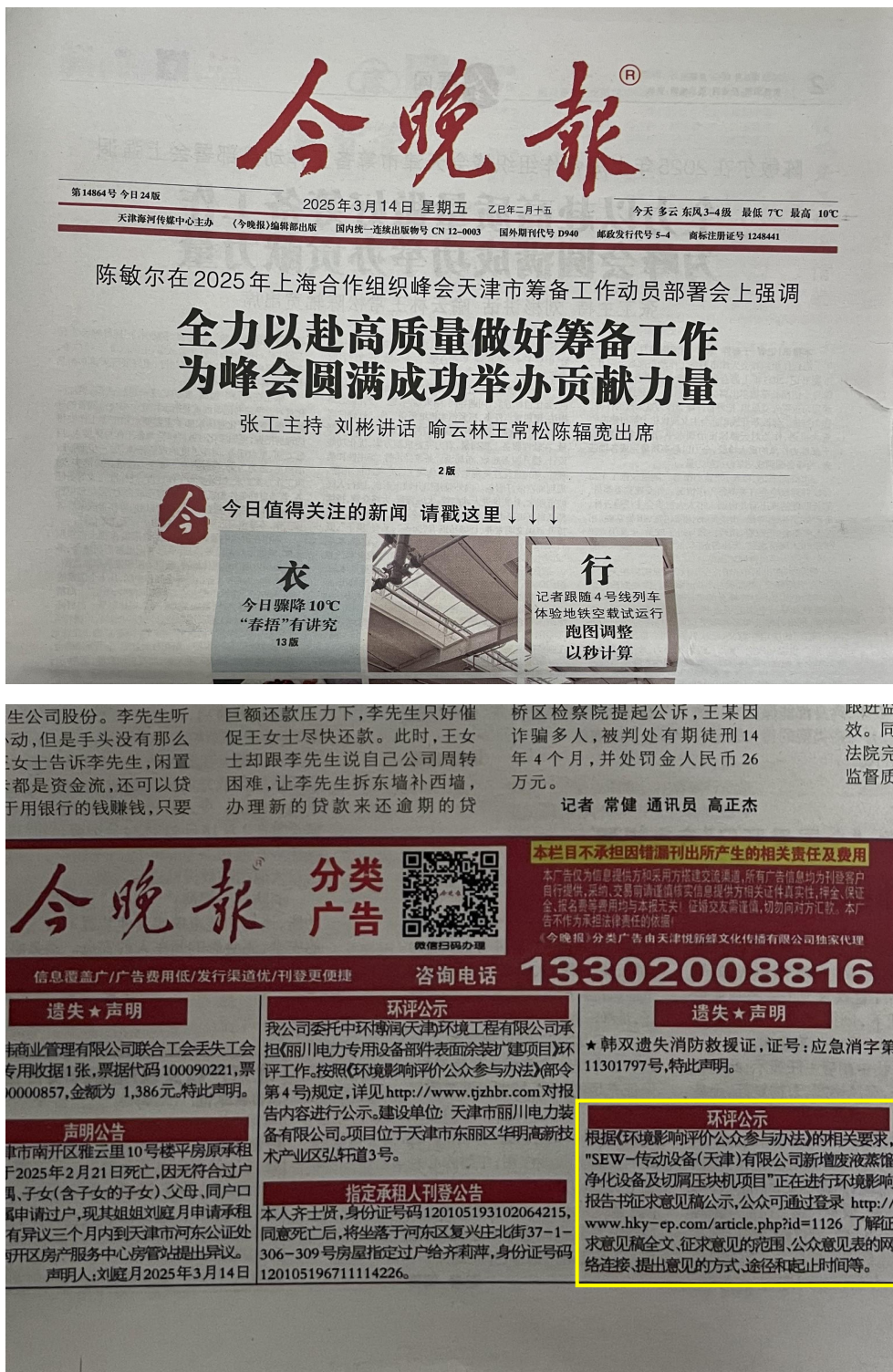
(一) 2025年3月14日报纸公示

本次报纸环评信息公示符合《环境影响评价公众参与办法》中第十一条“(二) 通过建设项目所在地公众易于接触的报纸公开,且在征求意见的 10 个工作日内公开信息不得少于 2 次”的相关规定。