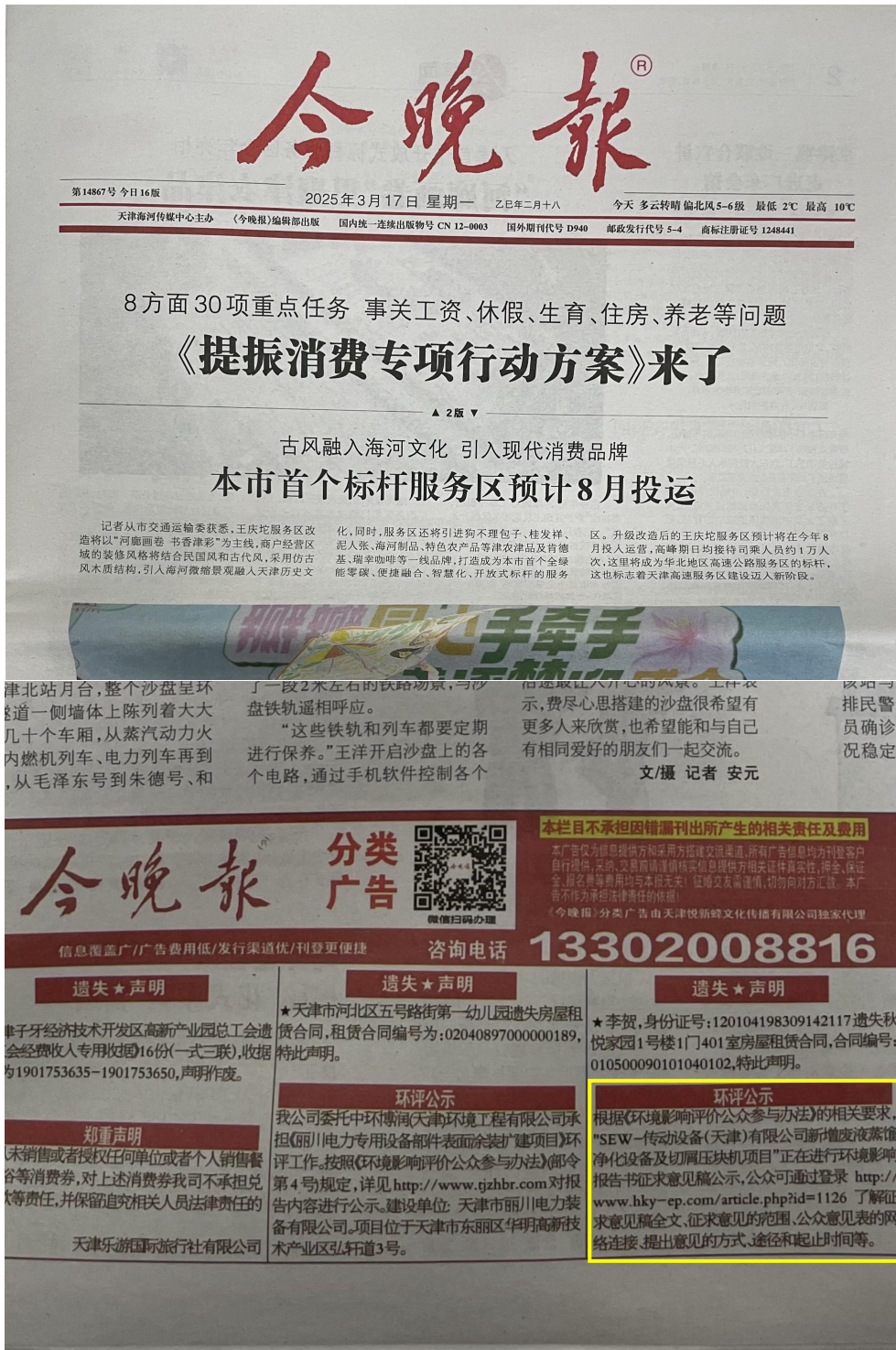
(二) 2025年3月17日报纸公示