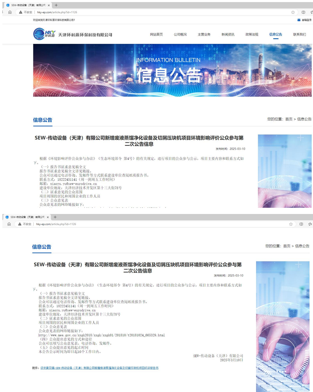
图 3.2-1 征求意见稿网络公示截图

本次网络公示符合《环境影响评价公众参与办法》中第十一条“(一) 通过网络平台公开，且持续公开期限不得少于10个工作日”。