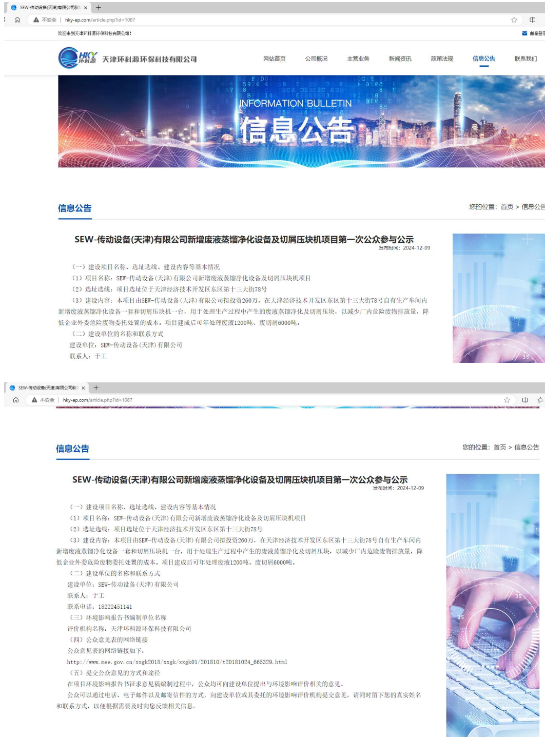
图 2.2-1 第一次信息公告网站截图

根据《环境影响评价公众参与办法》（生态环境部令第4号）第九条，“…通过其网站、建设项目所在地公共媒体网站或者建设项目所在地相关政府网站（以下统称网络平台），…”。因此，本次网络公示的载体选取符合上述规定要求。