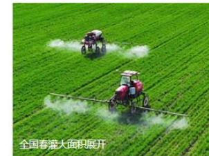
全国春灌大面积展开