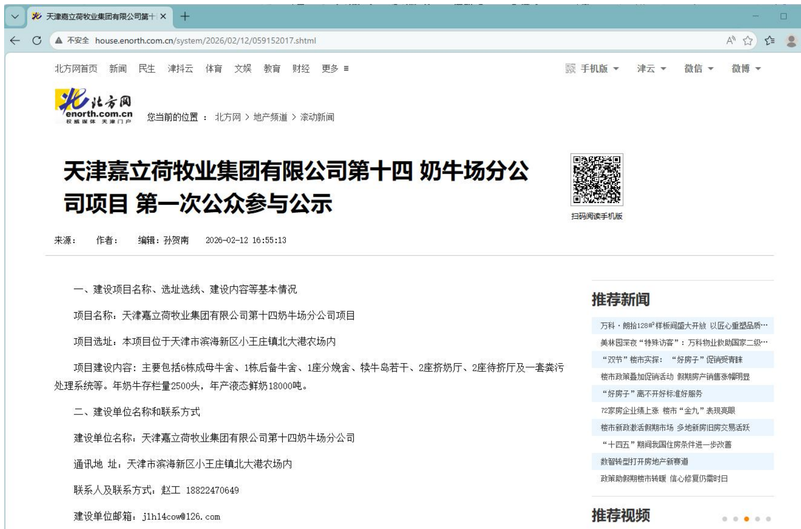
图 2-1 网上公众参与第一次信息公示截图