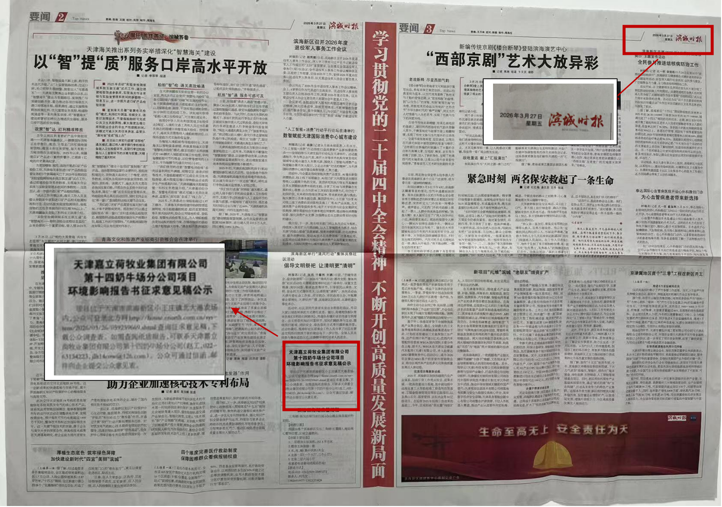
图 3-3 《滨城时报》2026 年 3 月 27 日刊登情况