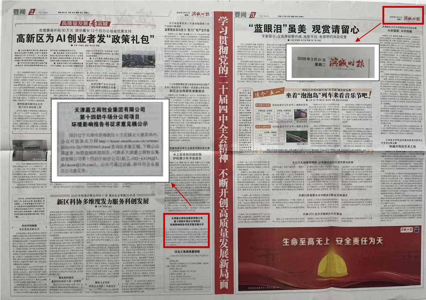
图 3-4 《滨城时报》2026 年 3 月 31 日刊登情况